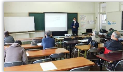
講話の様子 感染症予防を行い開催しました。

今後も当センターではボランティアの皆さんの活動の幅を広げられるよう、知識や情報の提供、相談などの支援を行っていきます。