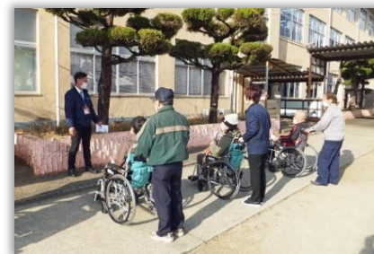
実習の様子 笑い声も聞こえる楽しい実習でした。