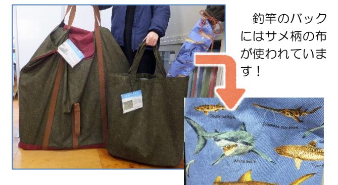
細部までこだわった、大きくて丈夫な布バックです。ご利用される際は、ぜひご覧ください。