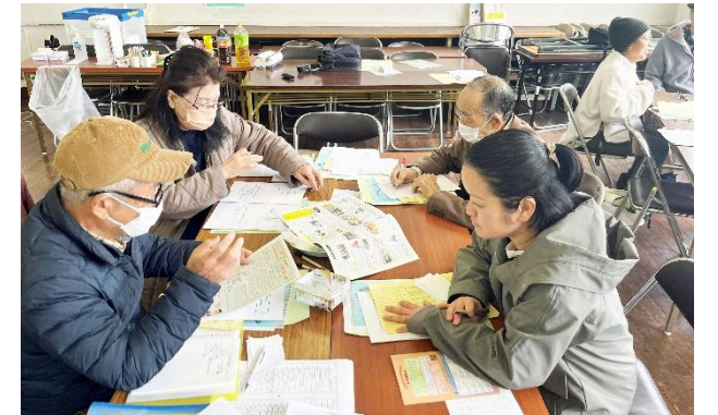
グループワークでは「夢のコラボ企画を考えよう」をテーマに様々なアイデアが出ていました。