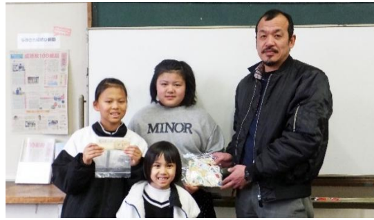
子どもたちより川尻センター長へ渡されました。

令和8年2月14日（土）、春日児童センターの子どもたち7名が佐世保市ボランティアセンターを訪れ、児童センターで集めた使用済み切手を寄贈していただきました。