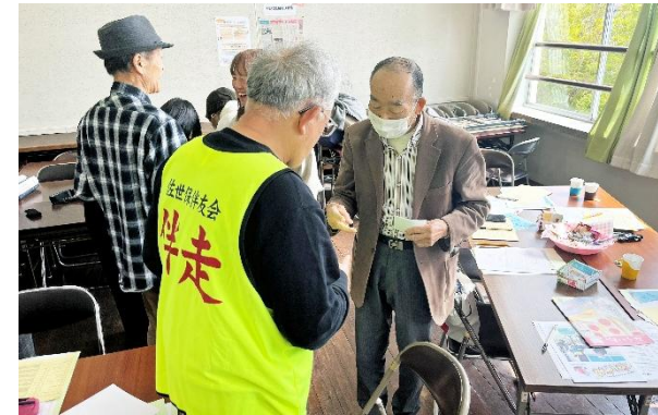
一人につき30秒、顔を合わせて自分の団体の活動内容と自己紹介を行いました。

参加者からは「他の団体の活動を知れて良かった」「時間が経つのがあっという間だった。また開催してほしい」との感想をいただき、とても有意義な時間だったと喜ばれていました。佐世保市ボランティアセンターは、今後もボランティア同士の架け橋となるように支援を行っていきます。