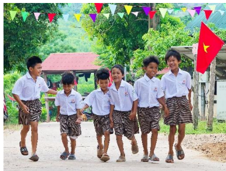
発展途上国の地方には、清潔な水の入手が難しく、電力がなく、通信インフラがない所があり、そのような場所に住む子どもたちの教育環境は劣悪です。「雨風が凌げる校舎がある」「図書室で読書ができる」「清潔なトイレがある」日本では当たり前のことを、とても感謝されます。