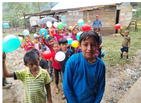
グアテマラの先住民集落にて、学校開校式で歓迎してくれる子どもたち。初めて見るだろう外国人に、とてもフレンドリーに接してくれました。