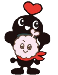
このキャラクターが目印！

開催期間に入りましたら参加方法が掲載されたチラシを配布しますので、ボランティアセンターまたは社会福祉協議会へお問い合わせください。