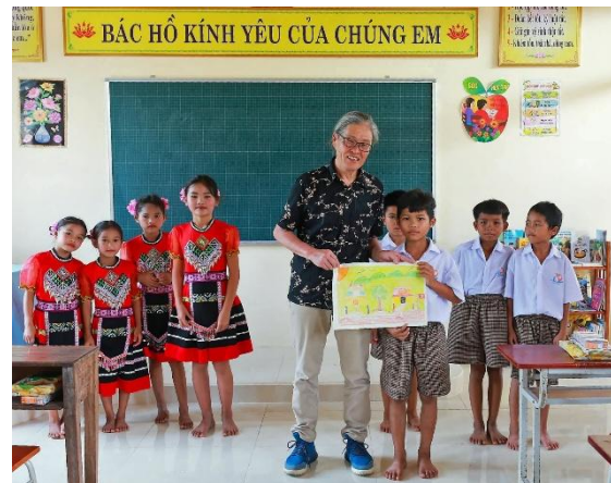
ベトナムの少数民族集落にて、初等教育学校開校式の様子。男の子から集落を描いた絵をプレゼントされました。

以来、その恩に報いたいと願ってきましたが、60年以上前のことで士官の消息は分かりません。それならば人を選ばずに恩を返そうと考え、貧困地域の教育支援をする国際NGOを通じて子どもたちの未来を応援しています。