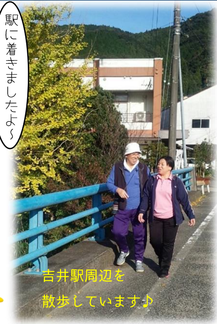
吉井駅周辺を 散歩しています♪

どうこうえんご 障害福祉サービスの一環で、視覚障害 により一人での移動や外出が困難な場 合に、ヘルパーが同行してガイドしたり 援護したりするサービスです。