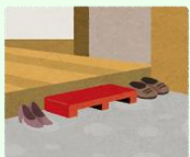
上がりかまちの段差解消