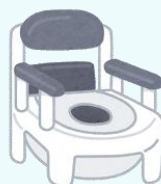
ポータブルトイレ