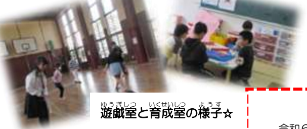
遊戯室と育成室の様子☆

児童センターは… 小学生および乳幼児(乳幼児は保護者同伴です)を対象にした「遊び場」です。利用料は無料。